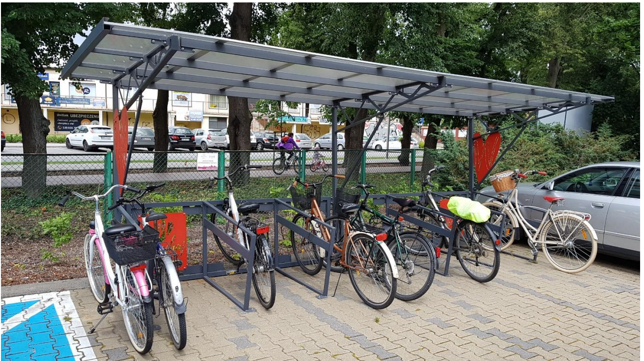
· Wiata rowerowa. 1 – zdjęcie pogładowe