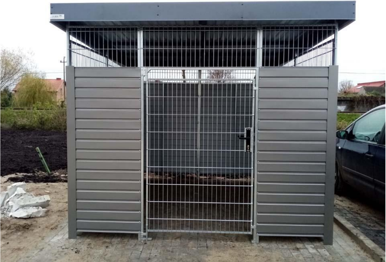
· Wiata śmietnikowa – zdjęcie pogładowe