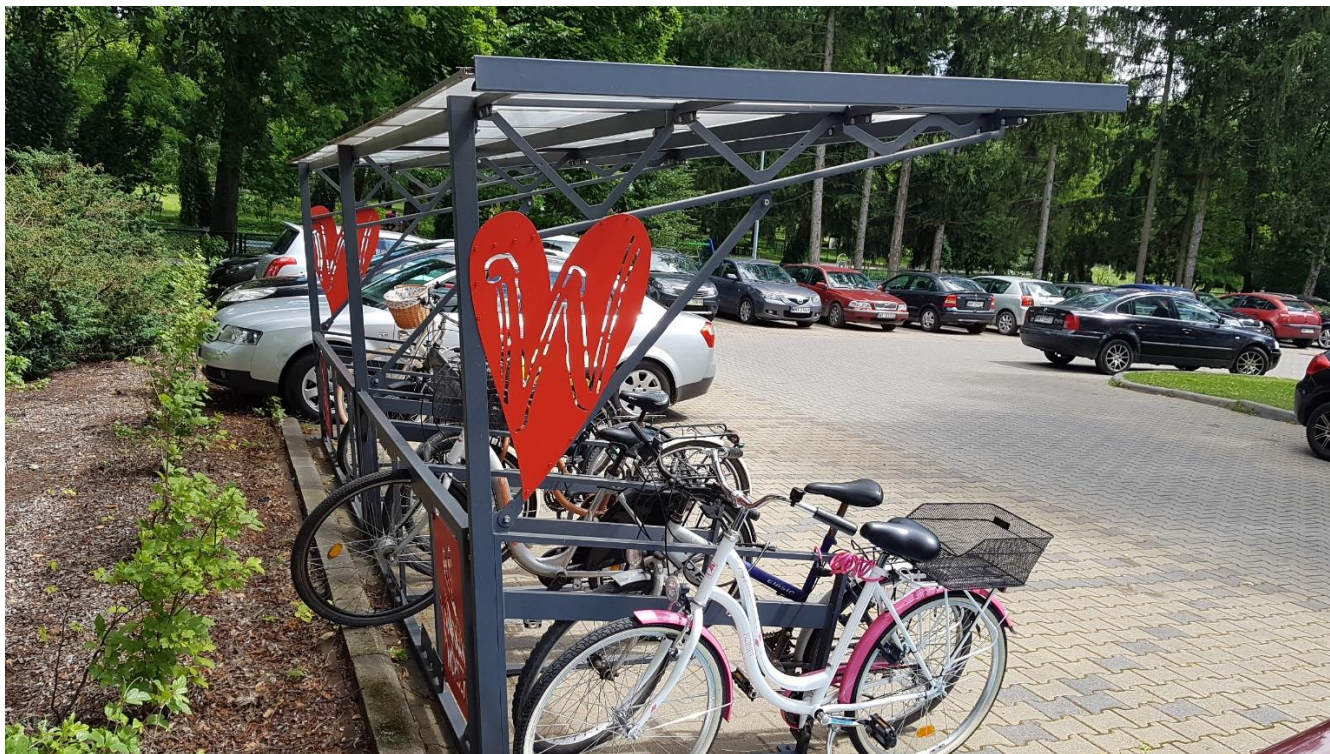
· Wiata rowerowa . 2 – zdjęcie poglądowe